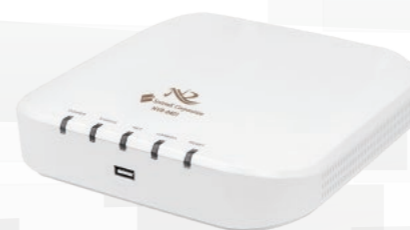
NVR-0401 4CH ネットワークビデオレコーダ