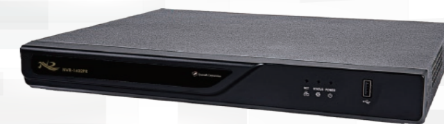
NVR-0802PR / NVR-1602PR 8CH ネットワークビデオレコーダ (PoEスイッチ内蔵) / 16CH ネットワークビデオレコーダ (PoEスイッチ内蔵)