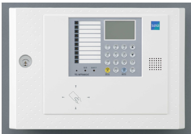
TS - MT 0 8 0 2 C送信機 (FeliCa カードリーダー内蔵タイプ)