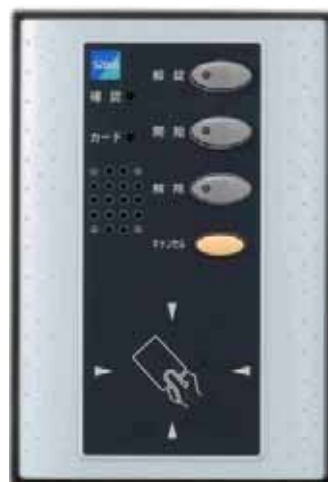
TS - SC 0 1 Cアクセスコントローラ