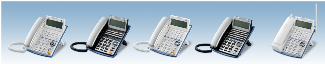
18 ボタン電話機 「TD710 電話機 (W)」 「TD710 電話機 (K)」 30 ボタン電話機 「TD720 電話機 (W)」 「TD720 電話機 (K)」 カールコードレス電話機 「CL720 電話機 (W)」

また、デザインについては、薄く、コンパクトな印象が際立つデザインで多様化するオフィス環境に対応するとともに、高品位な外観仕上げ、カラーリングによりオフィス空間に彩りを与えます。