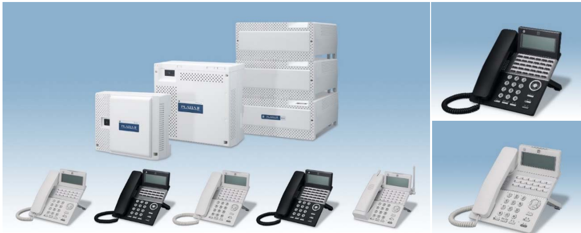
「PLATIA II シリーズ」

多機能電話機やコードレス電話機等を、より小規模オフィスから中規模オフィスまで幅広いお客様にご利用いただけるよう、シンプルながらも薄さが際立つフラットで高級感のあるデザインに刷新いたしました。