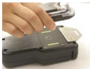
「車載端末」ど「おサイフケータイ」

今般の実証実験においては、まず、JCBカード保有者である神奈中ハイヤー職員(約20名)に「おサイフケータイ(1)」を配布いたします。職員は、「QUICPay」のアプリケーションを携帯電話にダウンロードした上で、タクシー(約30台)に乗車し、その乗車料金を携帯電話に搭載された「QUICPay」にて決済します。乗車料金の決済は、タクシーメータと連動した車載端末に携帯電話をかざすだけで完了するため、お客様はスピーディーに支払いを終えることができ、ご利用料金は、お持ちのJCBカードと合算で後日請求されます。