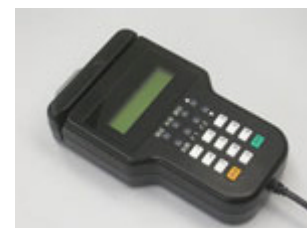
「車載端末」(乗務員側)