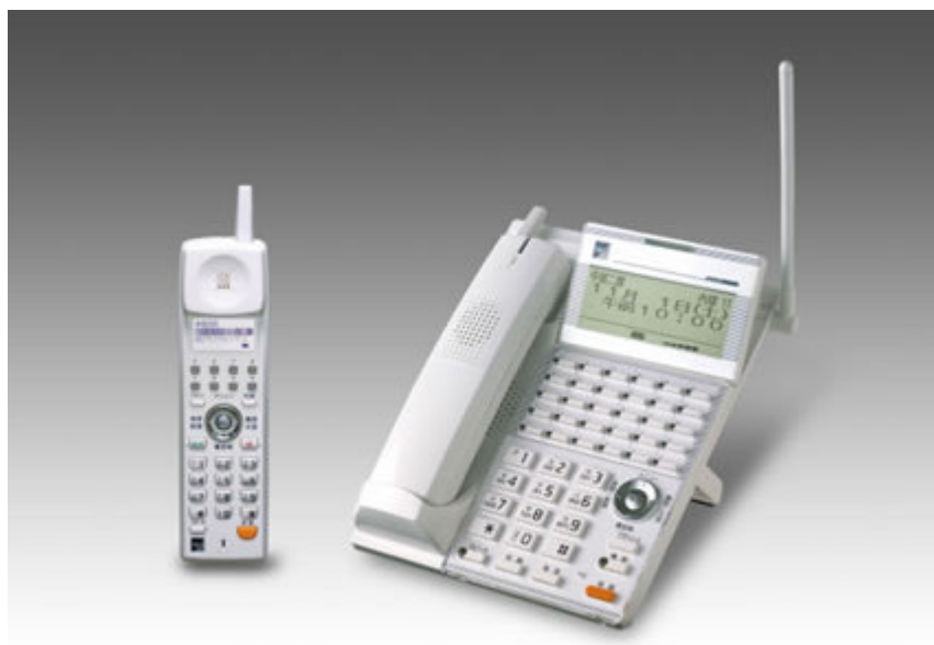
【コードレス子機 正面】

「CL500電話機」接続に、ACアダプタは不要です。(電話配線を利用して、給電します)