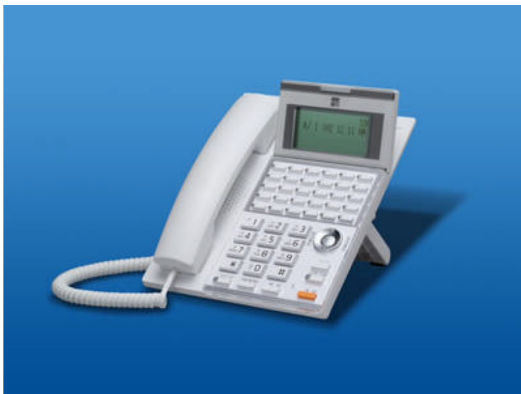
「IP NetPhone SX」