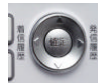
マルチファンクション (MF) キー

電話機の設定、アドレス帳、発着信履歴の表示/選択などは、電話機本体のディスプレイの表示内容に従って、「マルチファンクション (MF) キー」から操作できます。 携帯電話と同様の感覚で、簡単に操作できるので安心です。