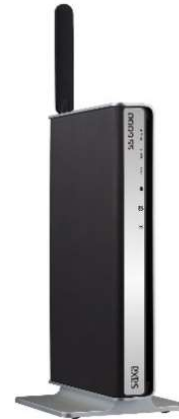
SS6000Pro（据置用品はオプション）