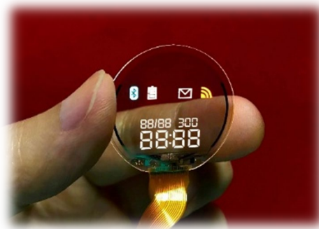
透過型 OLED の表示例

ソアーは長年にわたる技術の蓄積により、2025年6月に累計出荷台数100万台を達成いたしました。その後、透明UIを採用した製品の需要が想定を大きく上回るペースで拡大。直近の30万台については、これまでの平均出荷ペースと比較して約2.4倍の速度で推移し、130万台に到達いたしました。この急速な伸長は、「背景に溶け込むディスプレイ」という新しい価値が、製品デザインにおいて広く受け入れられ、一般的なUIへと本格的にシフトしていることを示しています。