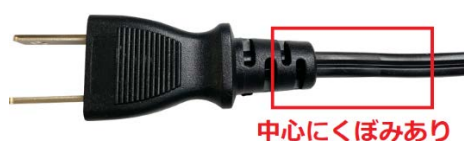
交換対象の電源コード