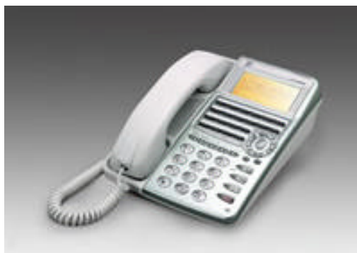
IP NETPHONE S