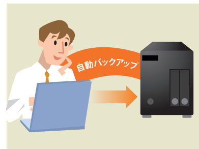
クライアントバックアップを使えば、定期的に自動でデータを保全でき、作業漏れもありません。