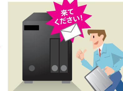
MW2000が自動でアラート通知し、専門の技術者による駆けつけ修理を行います。