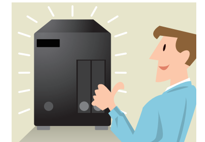
社内に管理者がいない場合でも、安心してお使いいただけます。