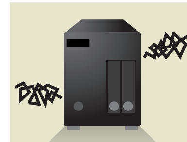
例えば、HDDが故障すると・・・

設置時から5年間分の無償機器保証(交換パーツ不要)が付いています。技術者による駆けつけ修理を行いますので、安心してお使いいただけます。