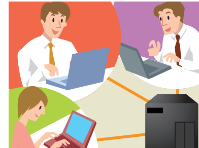
MW2000でデータが一括管理され、複数の人とファイル共有ができます。