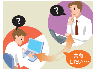
資料をみんなと共有したいけど、どうしたらいいかわからない。