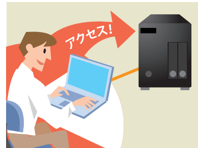
自分用のアカウントでログイン後(初回のみ)、共有フォルダに簡単アクセスできます。