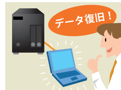
データ復旧も簡単にできるので、万が一のデータ消失時も安心です。