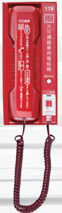
RTC-203F 火災通報専用電話機

火災通報装置 (一財)日本消防設備安全センター 適合認定品 認定番号 火通-041号 平成28年4月改正告示適合品