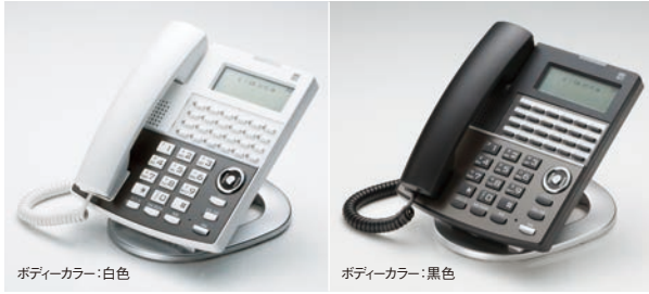
ボディカラー：白色

さまざまなオフィス環境にマッチするために、無駄な要素を極限まで排除したシンプルデザインです。高品位な外観仕上げにより、オフィス空間に彩りを与えます。カラーバリエーションはオフィスの設置環境に合わせて、白と黒の2色からお選びいただけます。